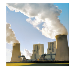
Wie viel Gas entweicht aus den Schloten?

Das ist ein Grundproblem in der Klimapolitik. Denn die Treibhausgasbudgets basieren auf Schätzungen der einzelnen Staaten und damit auch auf Angaben der Wirtschaft. Wie viel Kohlendioxid, Methan und