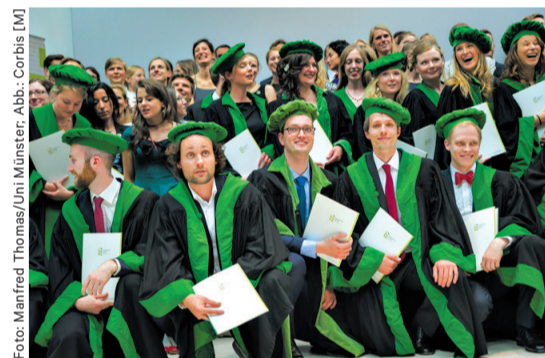
In Münster sprechen die Absolventen nach dem Medizinstudium das Genfer Gelöbnis. Grün ist die Farbe der Fakultät

Ausgearbeitet von der Arbeitsgruppe (Eidkommission) des schweizerischen Instituts Dialog Ethik, einer Non-Profit-Organisation in Zürich